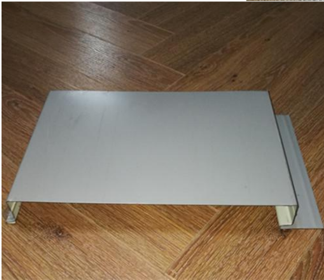
CX-W350 隐藏式墙板，材质选用：钢、铝、铜及不锈钢。