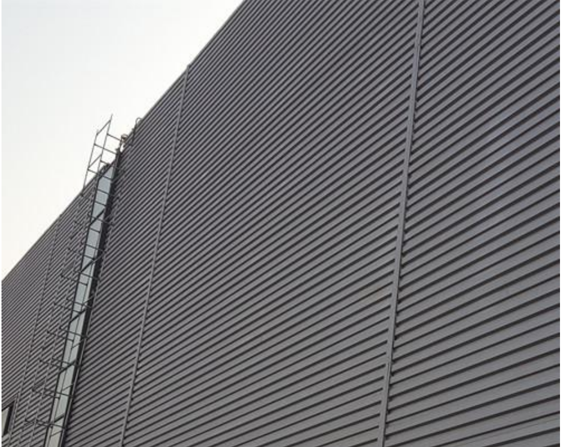
(图一，CX-W420 墙板完成效果图)

楚骁侧嵌板，也称谓隐藏式嵌入板，用于墙面和室内吊顶，根据外观效果现分为艺术纹、梯形、纯平、小波纹、大波纹五类，公母边侧嵌搭接，板面不露钉，耐腐蚀性强、美观度高、抗风性好。作为外墙用途时，常规按照横铺方式布置，基板选择灵活，可选用：彩涂钢板、铝镁锰板、不锈钢板、铜板等。使用建筑物领域：厂房、办公楼、商业住宅、别墅等。