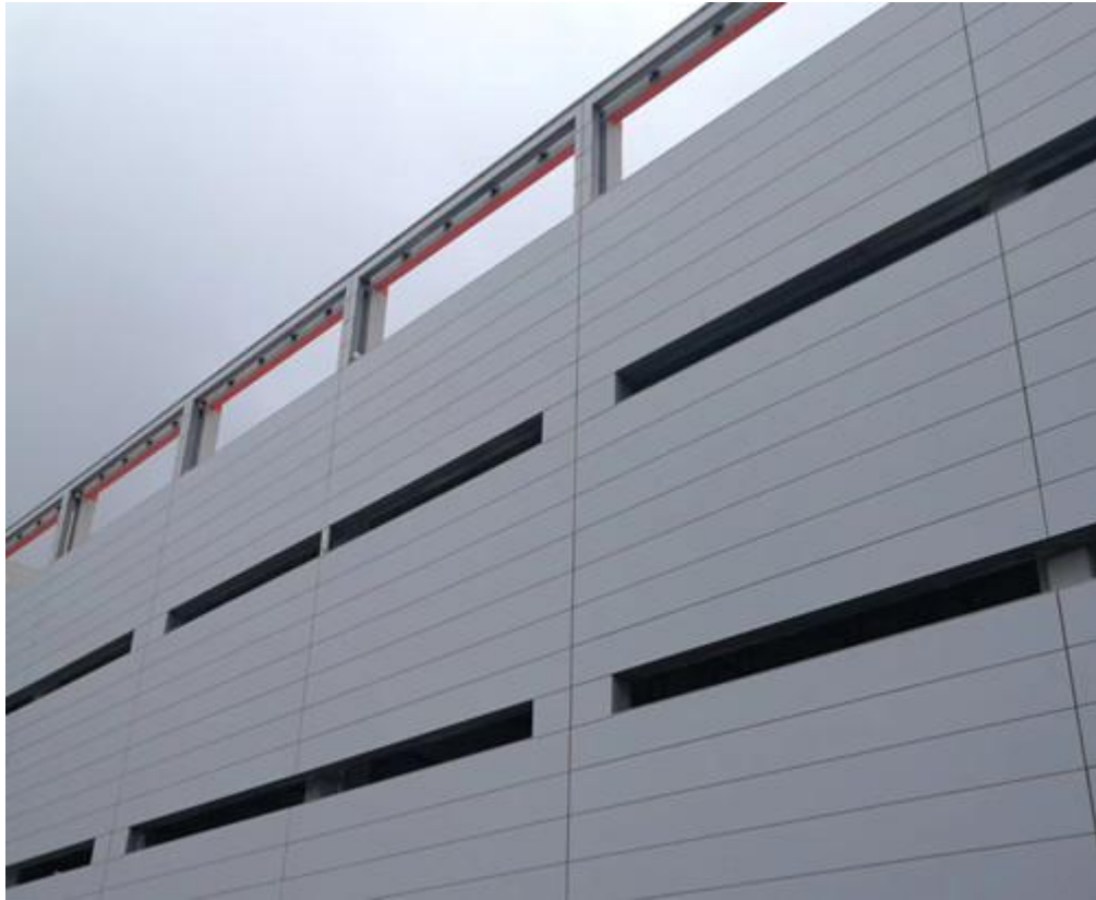
(图二, CX-W350 墙板完成效果图)