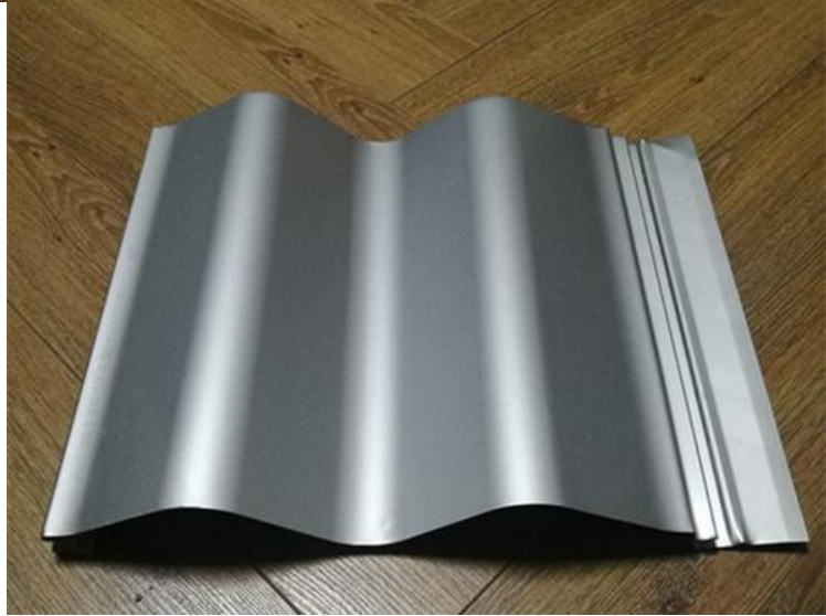
CX-W310A 隐藏式墙板，材质选用：钢、铝、铜及不锈钢