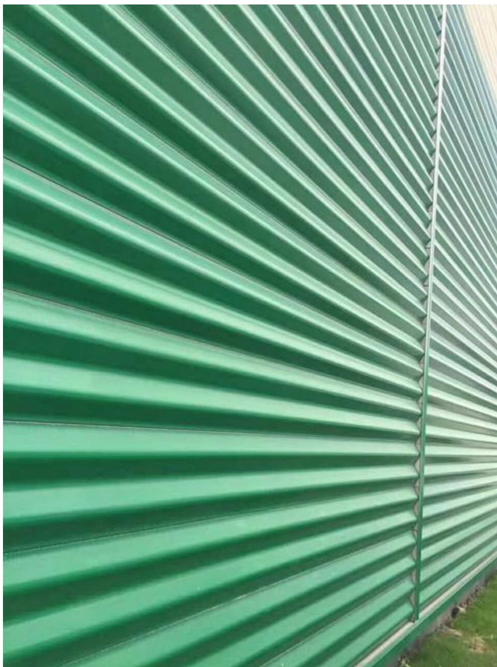
(图二，CX-W310A 墙板完成效果图)